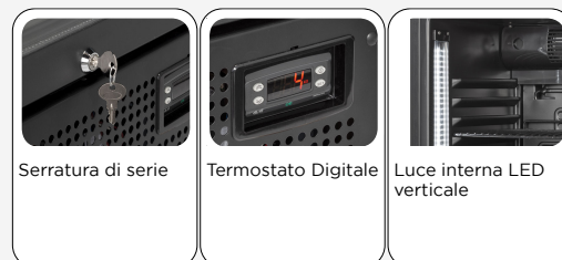
Serratura di serie